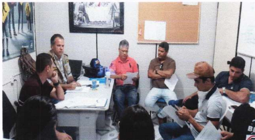
Sede da SMTT – Reunião do Comitê de Crise

As ações em 2020 seguiram cronograma de serviços do ano anterior (exercício 2019), contudo, em decorrência da Pandemia Internacional ocasionada pela infecção humana pelo Coronavírus SARS-CoV-2 (COVID-19) , com impactos que transcendem a saúde pública e afetam a economia como um todo; a Autarquia Municipal de Trânsito participou de forma direta e indireta no combate a transmissão do vírus, tendo a SMTT de Itabaianinha/Se cadeira cativa no Comitê de Gestão implantado no Município de Itabaianinha/SE.